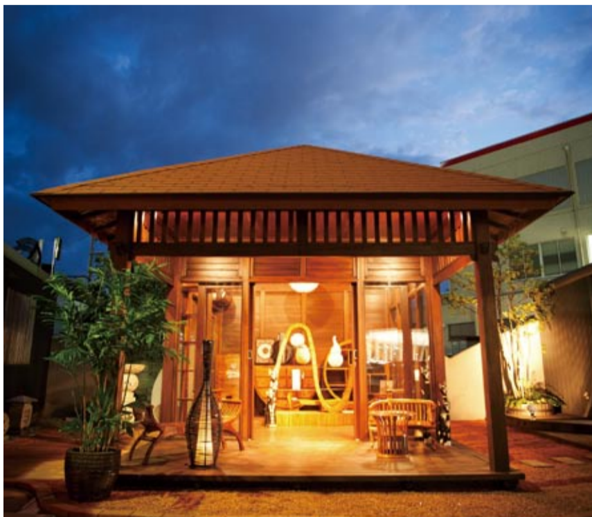
新店舗のテーマは、「アジアの極上を毎日の暮らしに」。[笠間仏壇 元町店]の敷地に設けた新店舗は、バリ島の建築「バレ」(東屋)をイメージ。ライトアップされた美しい風景が、通行する人たちの注目を集めている。